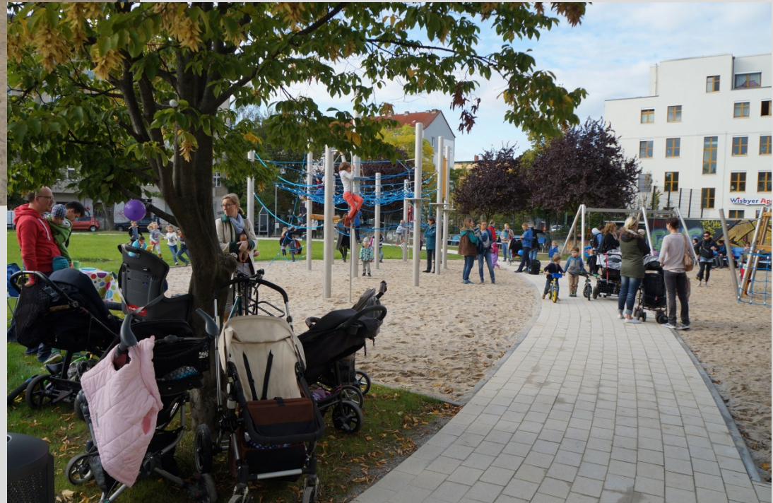
Doppel- und Nestschaukel