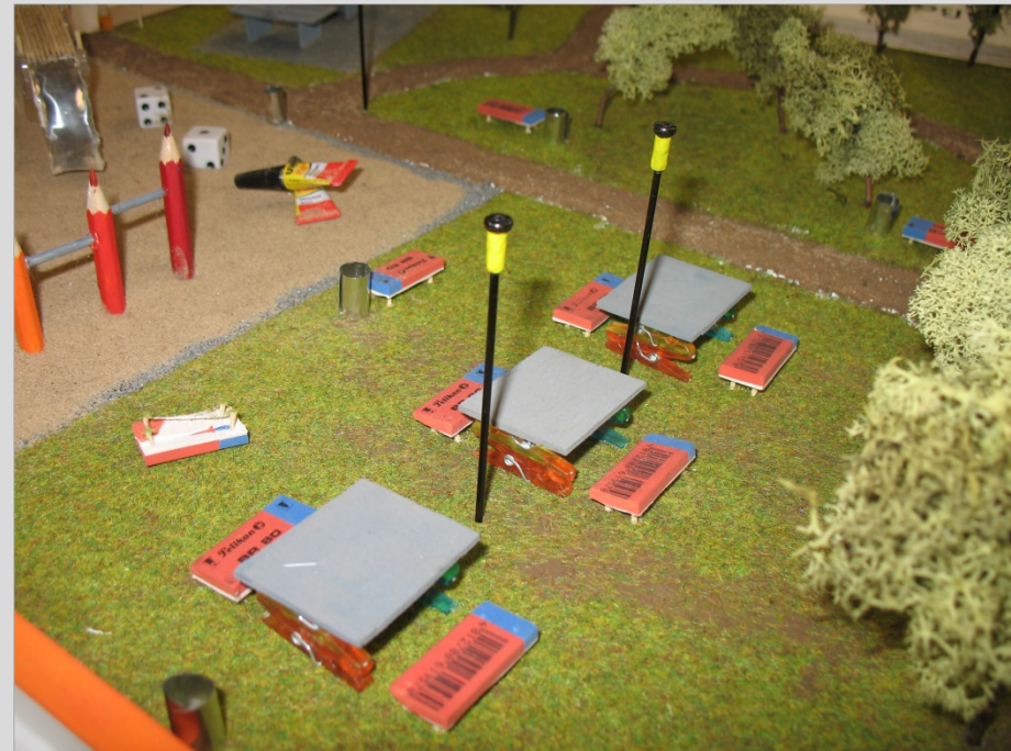
Schreibgeräte als Modellbaumaterial